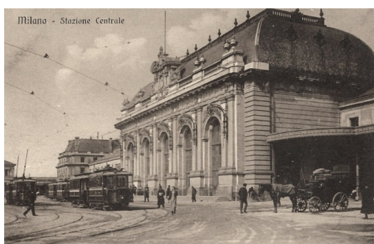
La vecchia Stazione Centrale di Milano in una cartolina del 1910 circa