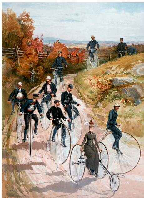
In velocipede, litografia, da Sandham Henry, pubblicato da L. Prang & Co, 1887