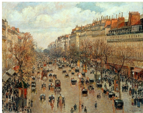
Camille Pissarro , Boulevard Montmartre in un mattino d’inverno , 1897, olio su tela, New York, The Metropolitan Museum of Art