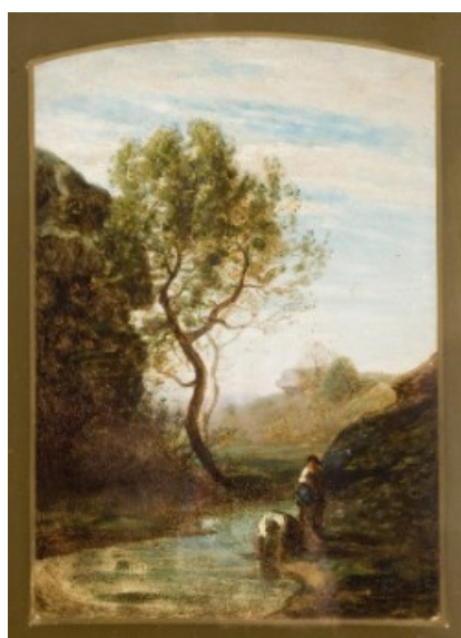
Galleria d'Arte Moderna "Ricci Oddi" - Piacenza (PC) - Fontanesi Antonio 1818/ 1882 - Due lavandaie accanto a un laghetto