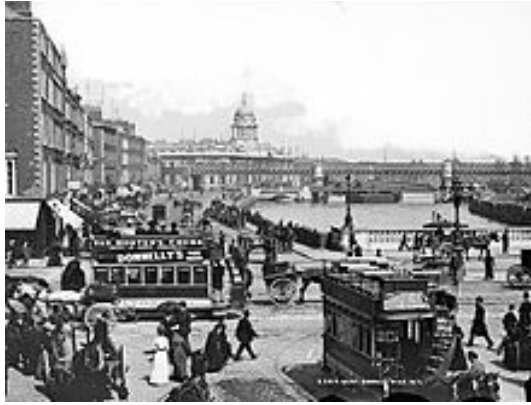
La città di Dublino - Corner of Eden Quay e Ponte O'Connell, 1897