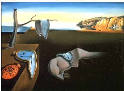
Salvador Dalí, La persistenza della memoria , 1931, olio su tela, 24 x 33 cm. New York, Museum of Modern Art (MoMa)