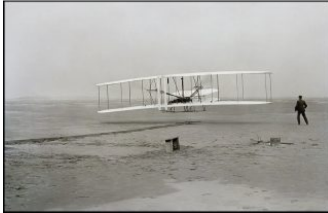
“Il Flyer”, 1903, dei fratelli Wright. Fotografia di John T. Daniels, tratta dal sito di Wikipedia, l’enciclopedia libera.