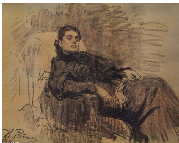
Ilya Yefimovich Repin - Stile: realismo - Temi: Ritratto dell'attrice italiana Eleonora Duse - Data: 1891