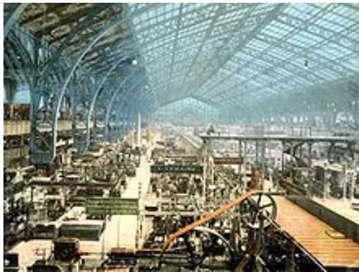
Galleria delle macchine all' Esposizione universale del 1900 a Parigi