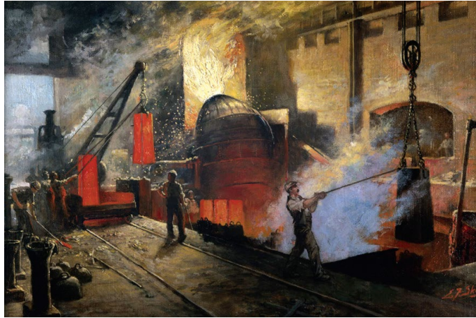
E. F. Skinner, Produzione dell'acciaio con il processo Bessemer , 1917.